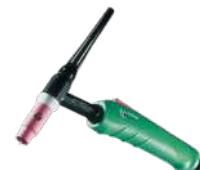
ERGOTIC 17 17304140717