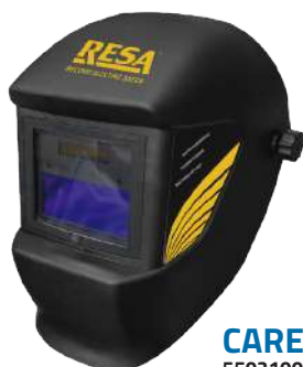
CARETA ELECTRÓNICA 55021004000 WH4000/40001