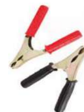
Pinza para batería