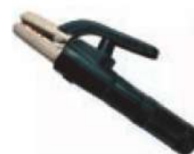
Pinza porta electrodo