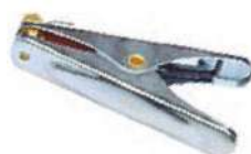
Pinza porta masa